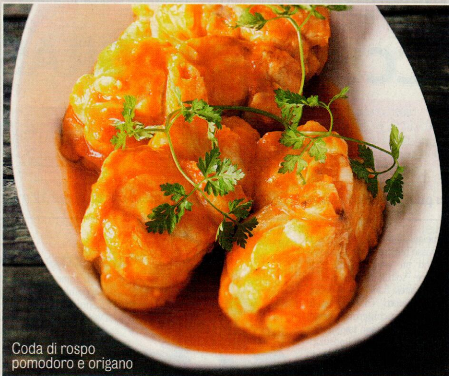
Coda di rospo pomodoro e origano